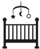
Lit et chaise bébé